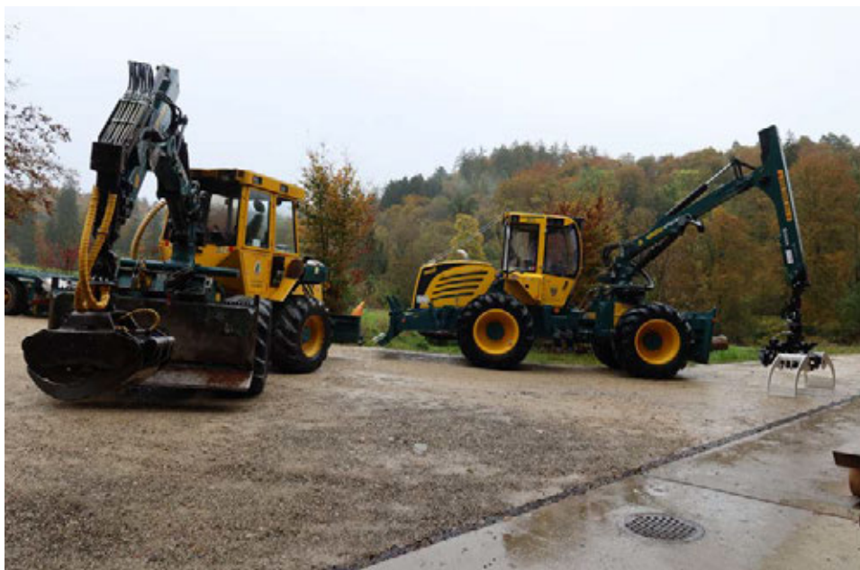
Forstschelepper HSM 704 (links) und neuer HSM 805

Im November konnte der neue Forstspezialschlepper HSM 805 in Betrieb genommen werden. Dieser wurde in der Holzerei bereits erfolgreich eingesetzt.