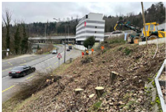
Arbeiten für Dritte

Es konnten einige Aufträge von Privaten im Bereich der Gartenholzerei ausgeführt werden. Auch wurden zu Gunsten der Autobahnbrücke in Wettingen einige Bäume gefällt. Für das Hotel Ibis wurden in Neuenhof kranke Eschen entfernt.