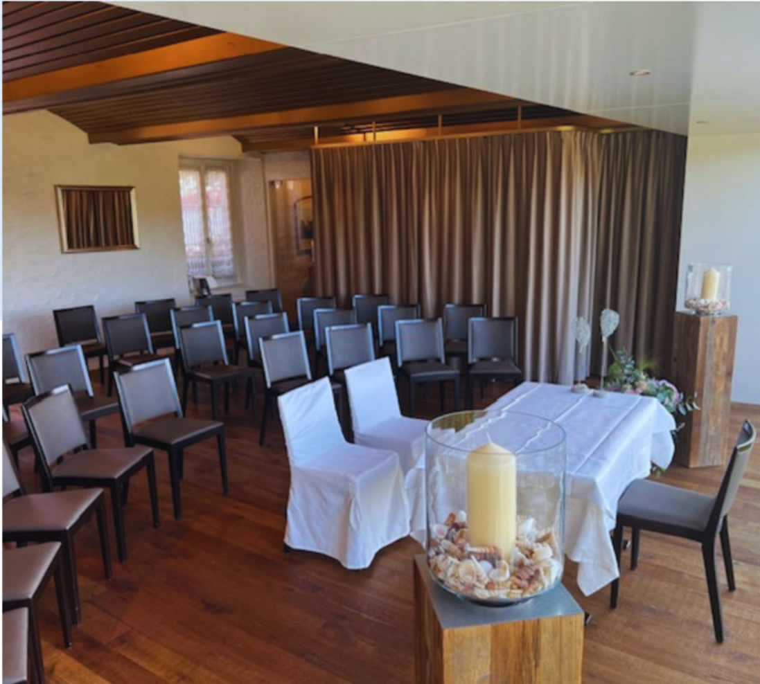
Traulokal "Rittersaal" bis 30 Gäste (plus Hochzeitspaar und Trauzeugen)

Mehrkosten Schloss Scharnenfels während der Woche Fr. 100.00 Samstag Fr. 150.00