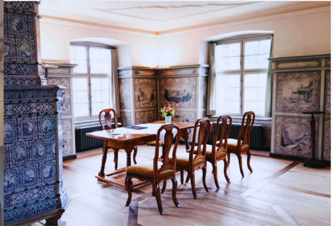
Traulokal "Abtstube" bis 7 Gäste (plus Hochzeitspaar und Trauzeugen)

Diese Oase der Stille in Unterengstringen bietet Ihnen den idealen Rahmen für eine stilvolle zivile Trauung.