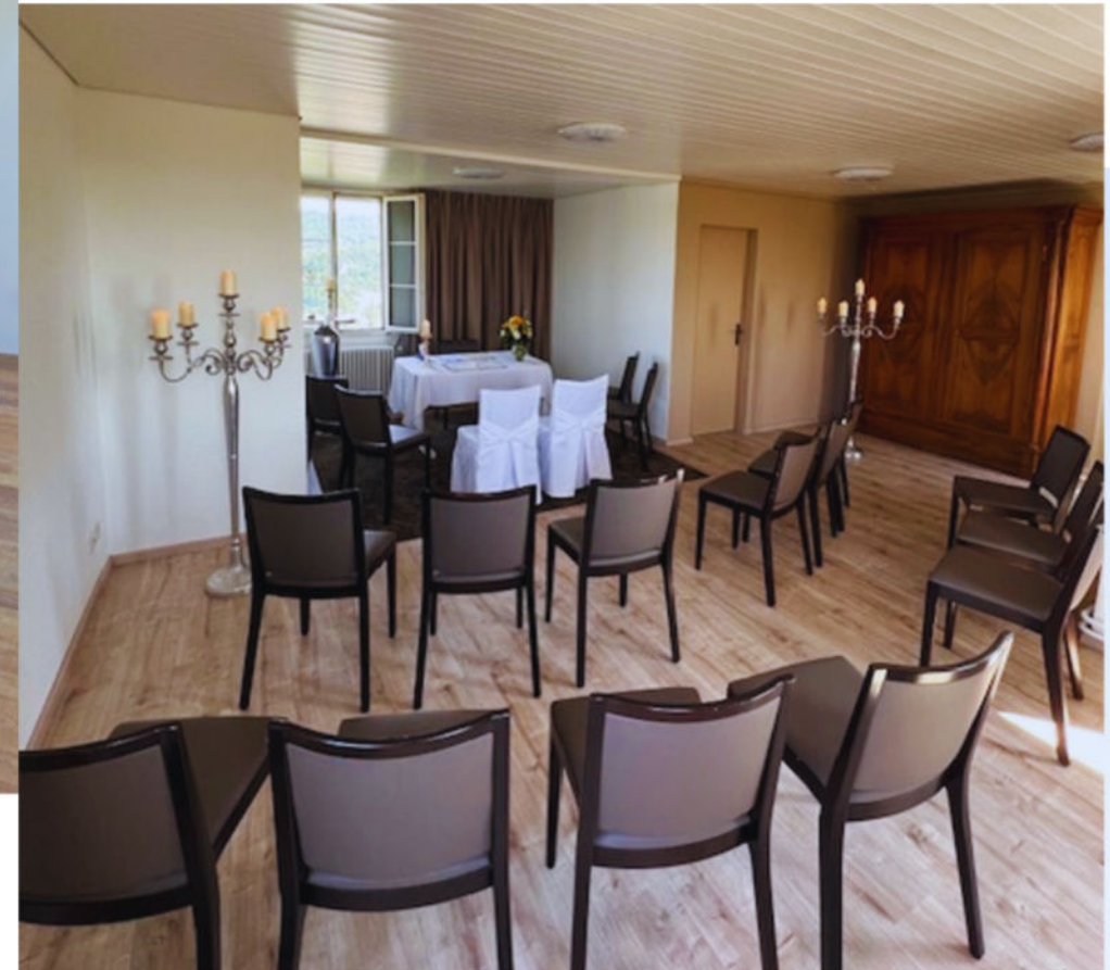
Traulokal "Traustube" bis 15 Gäste (plus Hochzeitspaar und Trauzeugen)

Heiraten hoch über Wettingen, im altehrwürdigen Schloss Scharnenfels mit angrenzendem Restaurant. Die Traulokale bieten einen prächtigen Blick über das Limmattal.