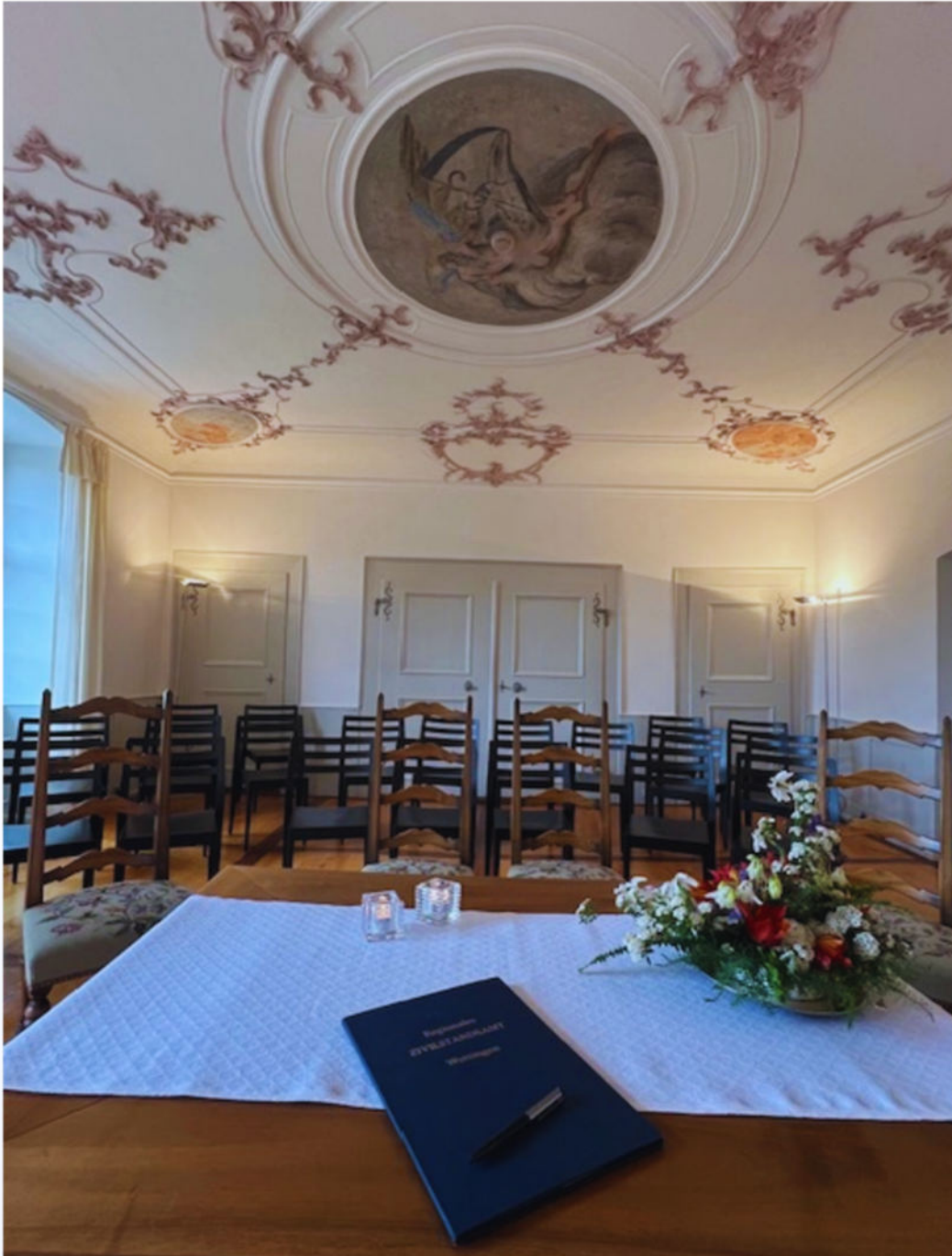
Traulokal "vier Jahreszeiten" bis 20 Gäste (plus Hochzeitspaar und Trauzeugen)