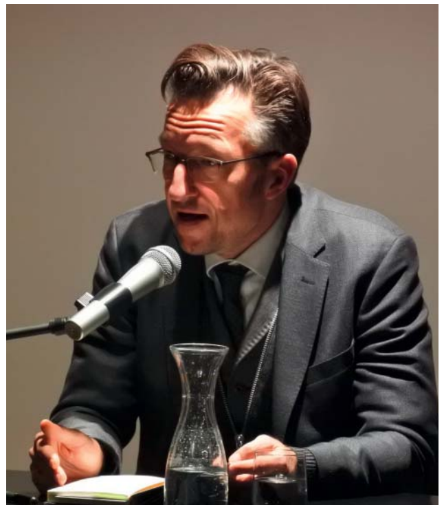
Lesung mit Lukas Bärffuss.