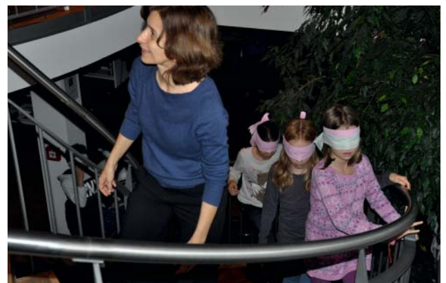
Erzählnacht unter dem Motto «Mutig, Mutig».

Die Bibliothek war im September am Kulturmeilenfest mit dabei. Dabei konnten Interessierte vor dem Eduard Spörri Museum unter Anleitung Origami falten.