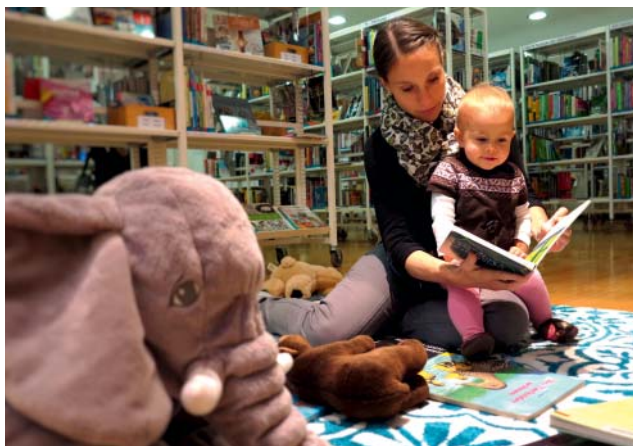
Familien mit Kindern sind die Zielgruppe der Bibliothek.

Das Jahr 2017 war geprägt von der Softwareumstellung, welche im November erfolgreich über die Bühne ging. Die aktive Benutzerschaft und die Ausleihzahlen konnten im Vergleich zum Vorjahr dank den eMedien auf hohem Niveau stabil gehalten werden. Auch bei den Veranstaltungen für Kinder konnte die Bibliothek nochmals zulegen.