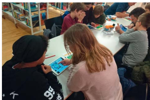
Minecraft-Challenge in der Bibliothek.

2017 hat das Bibliotheksteam Wettingen wiederum alternierend mit dem Bibliotheksteam Baden Buch- und Medientipps für die Wochenzeitung «Rundschau Baden-Wettingen» geschrieben. Weiter wurde auch wieder die Sommer-Lese-Aktion «Gratis-Bücher» im Schwimmbad täger durchgeführt.